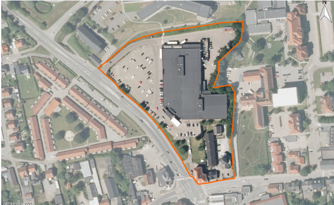
Figur 1: Lokalplanområdets afgrænsning markeret med orange streg