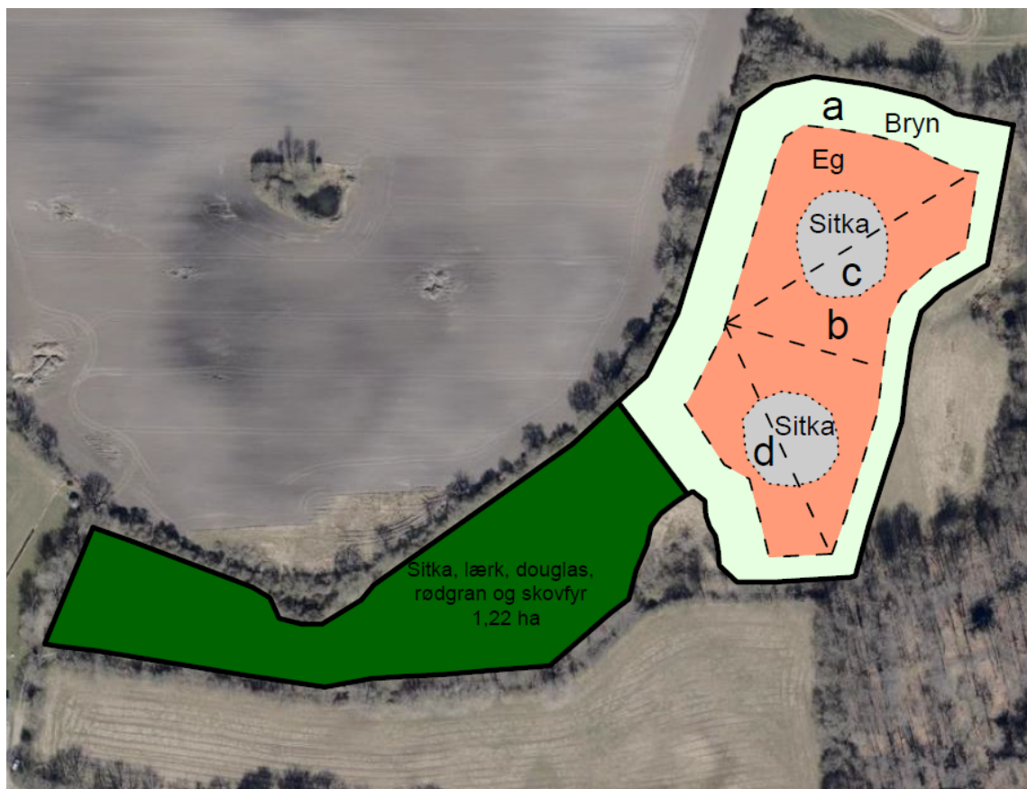
Skovkort, forventet arts sammensætning