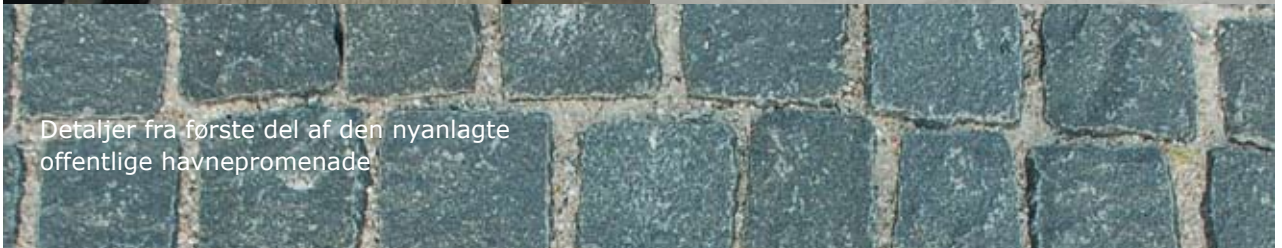
Detaljer fra første del af den nyanlagte offentlige havnepromenade