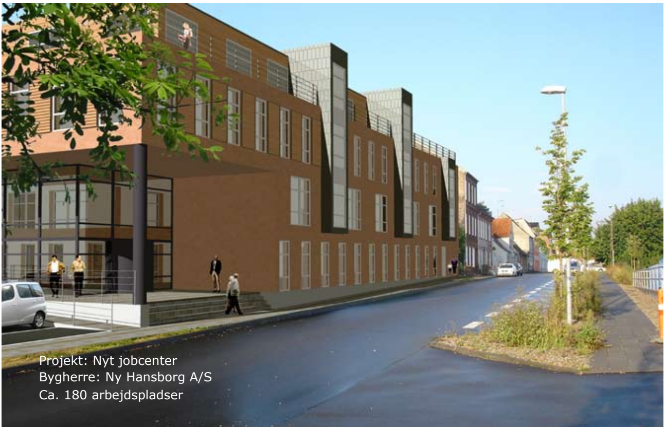
Projekt: Nyt jobcenter Bygherre: Ny Hansborg A/S Ca. 180 arbejdspladser