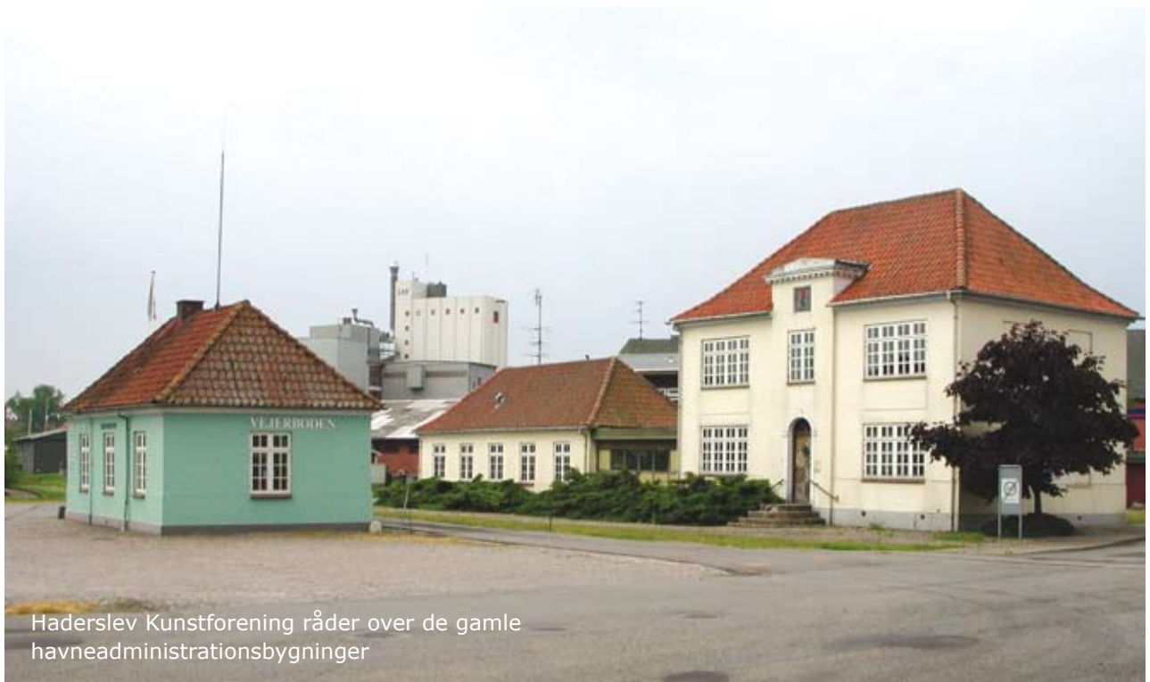
Haderslev Kunstforening råder over de gamle havneadministrationsbygninger