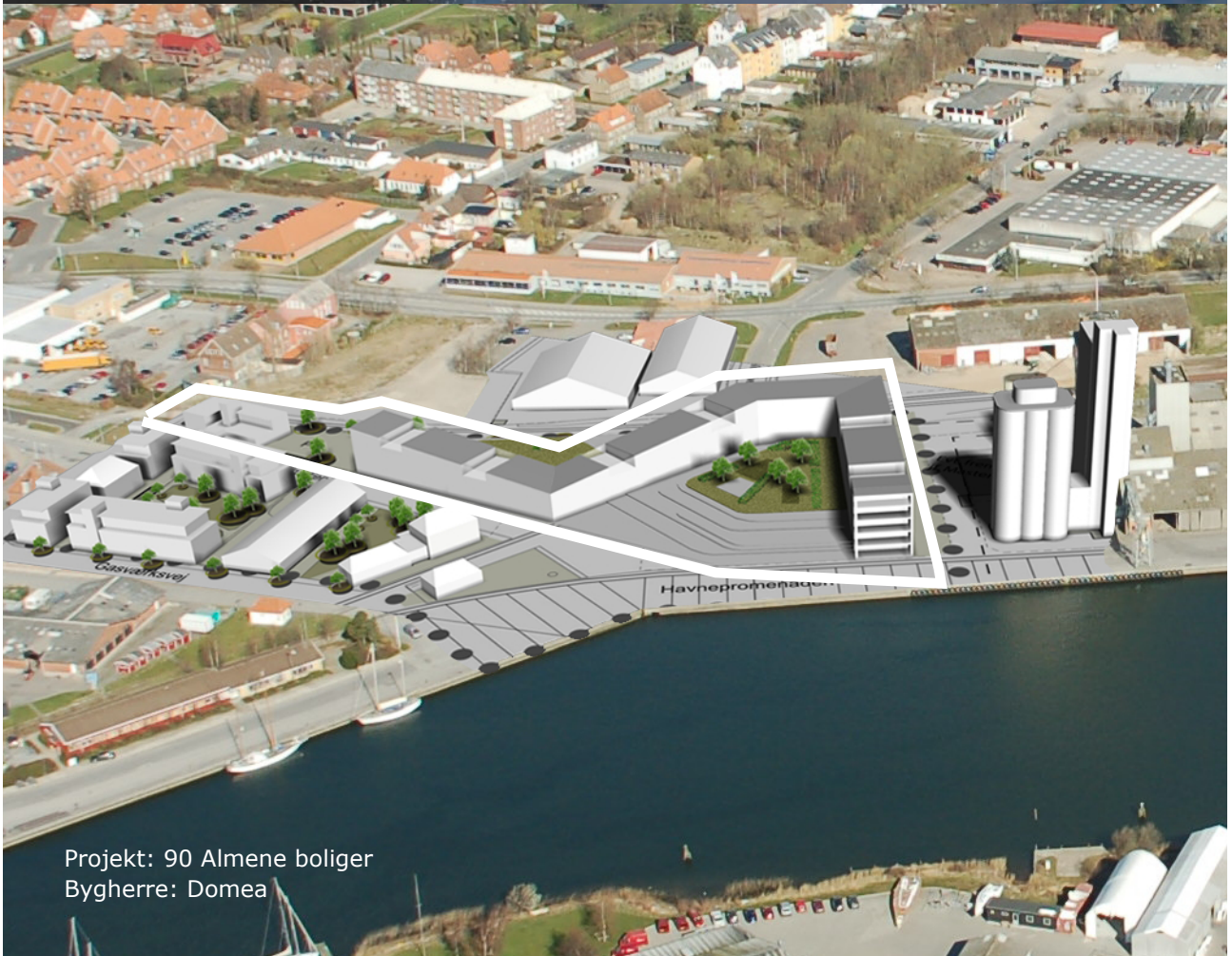
Projekt: 90 Almene boliger Bygherre: Domea