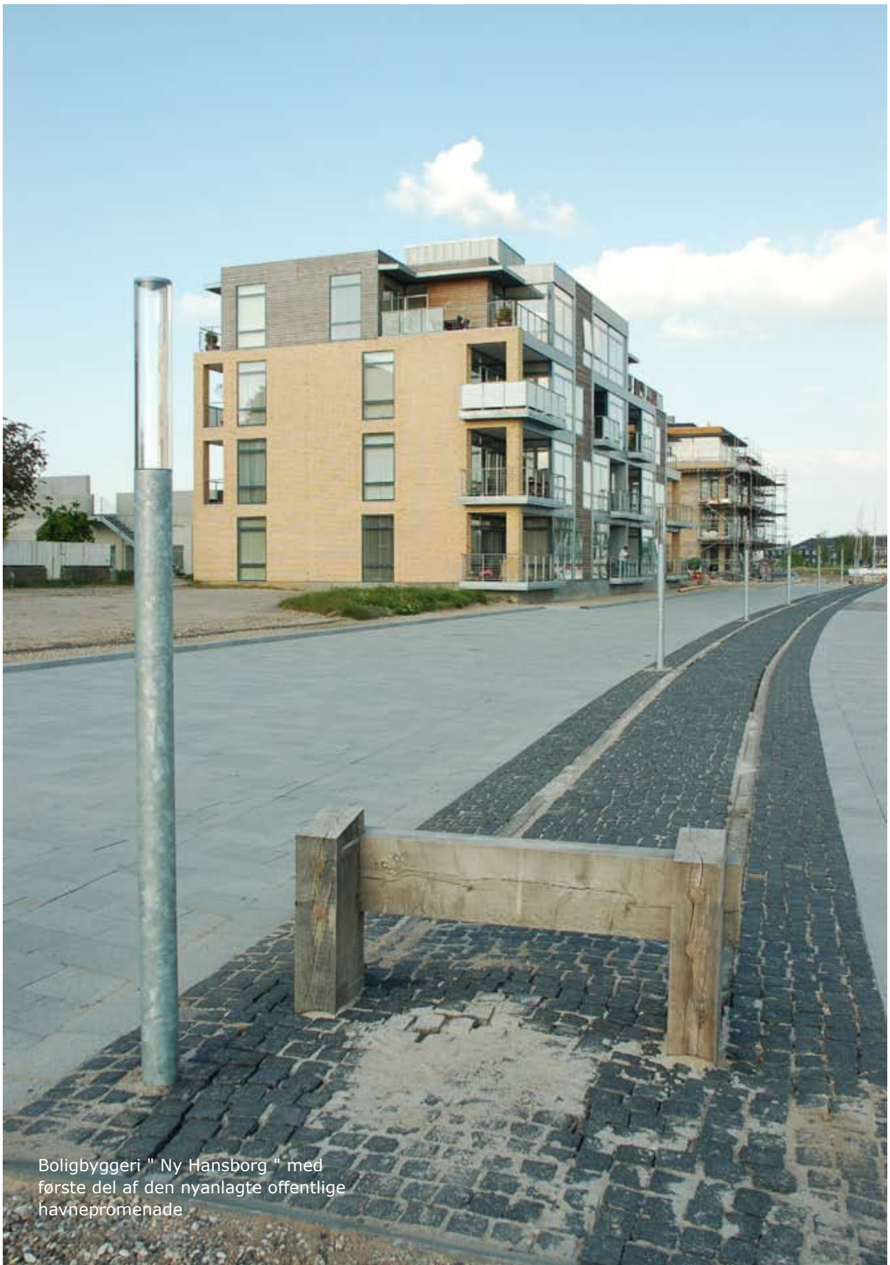
Boligbyggeri " Ny Hansborg " med første del af den nyanlagte offentlige havnepromenade