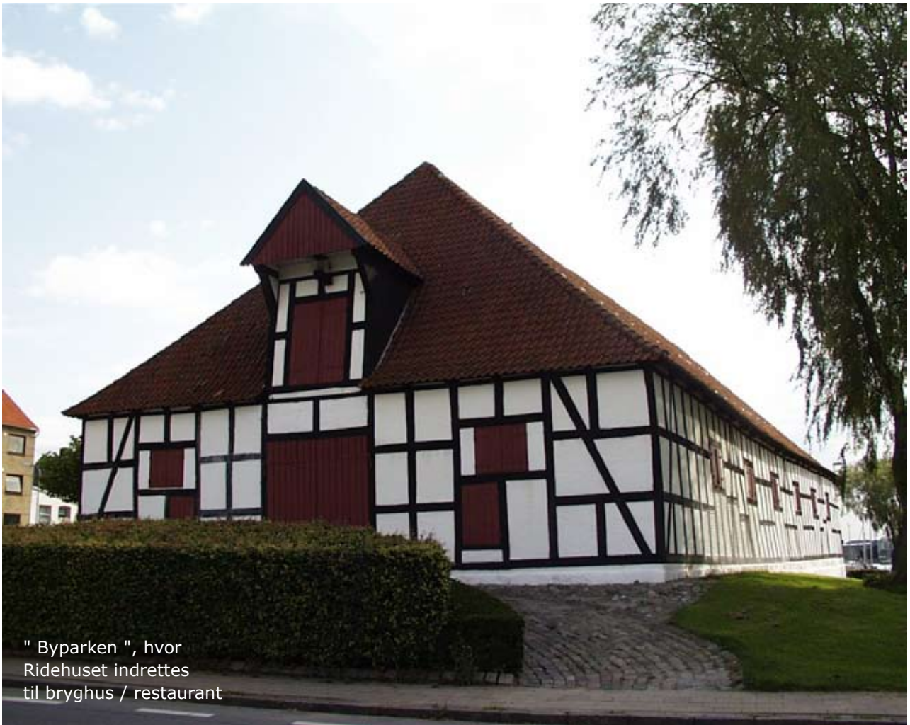
" Byparken ", hvor Ridehuset indrettes til bryghus / restaurant