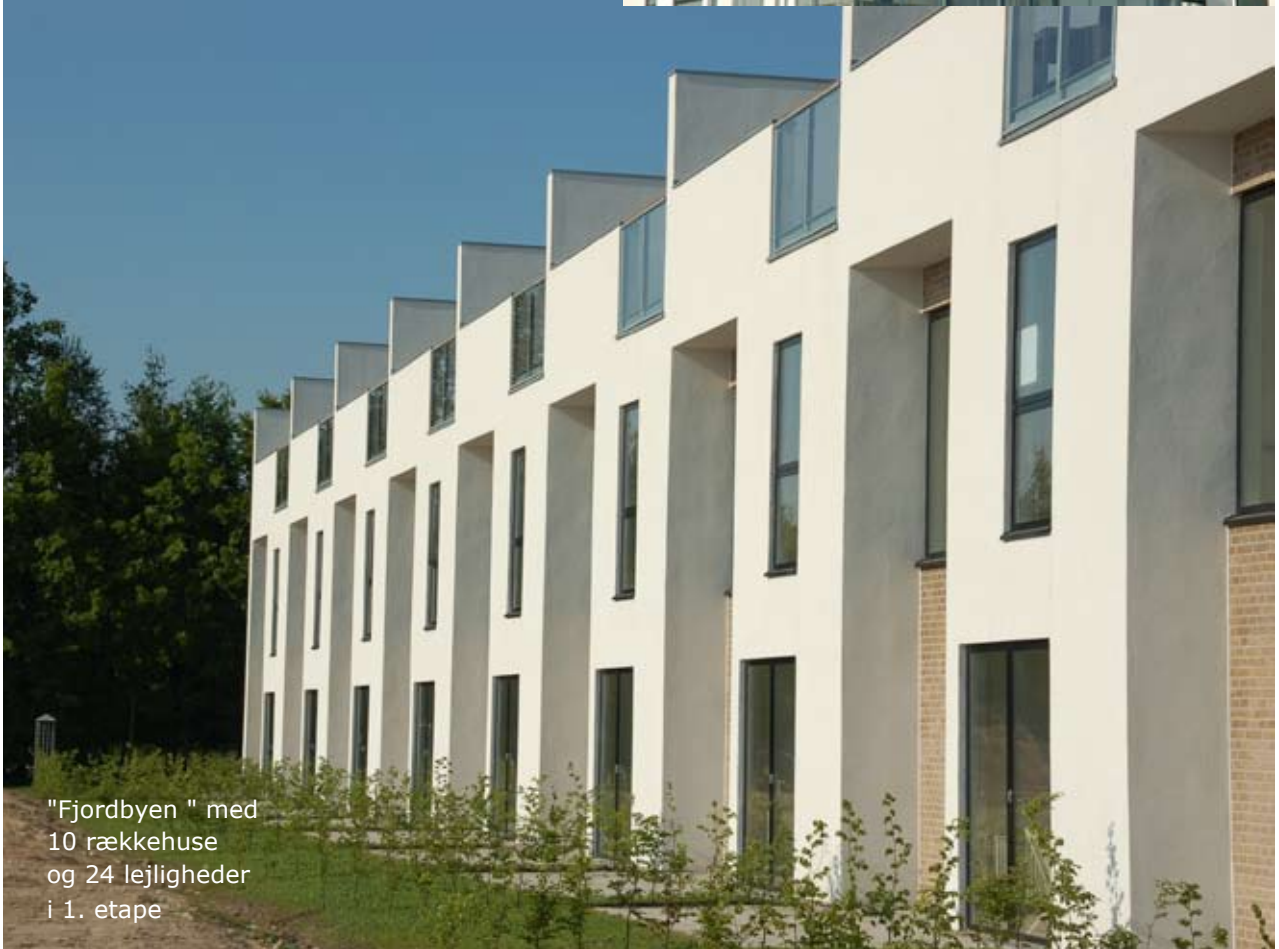
"Fjordbyen " med 10 rækkehuse og 24 lejligheder i 1. etape