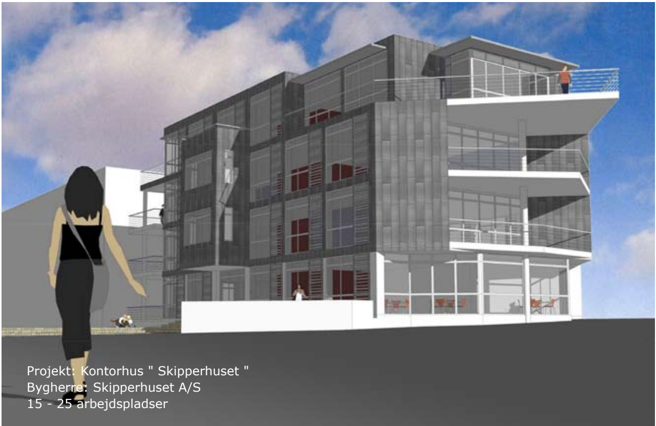
Projekt: Kontorhus " Skipperhuset " Bygherre: Skipperhuset A/S 15 - 25 arbejdspladser