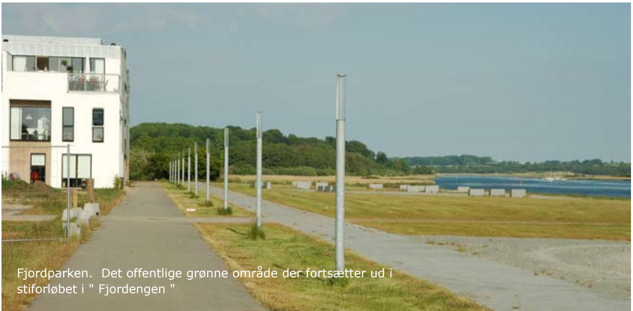
Fjordparken. Det offentlige grønne område der fortsætter ud i stiferløbet i " Fjordengen "