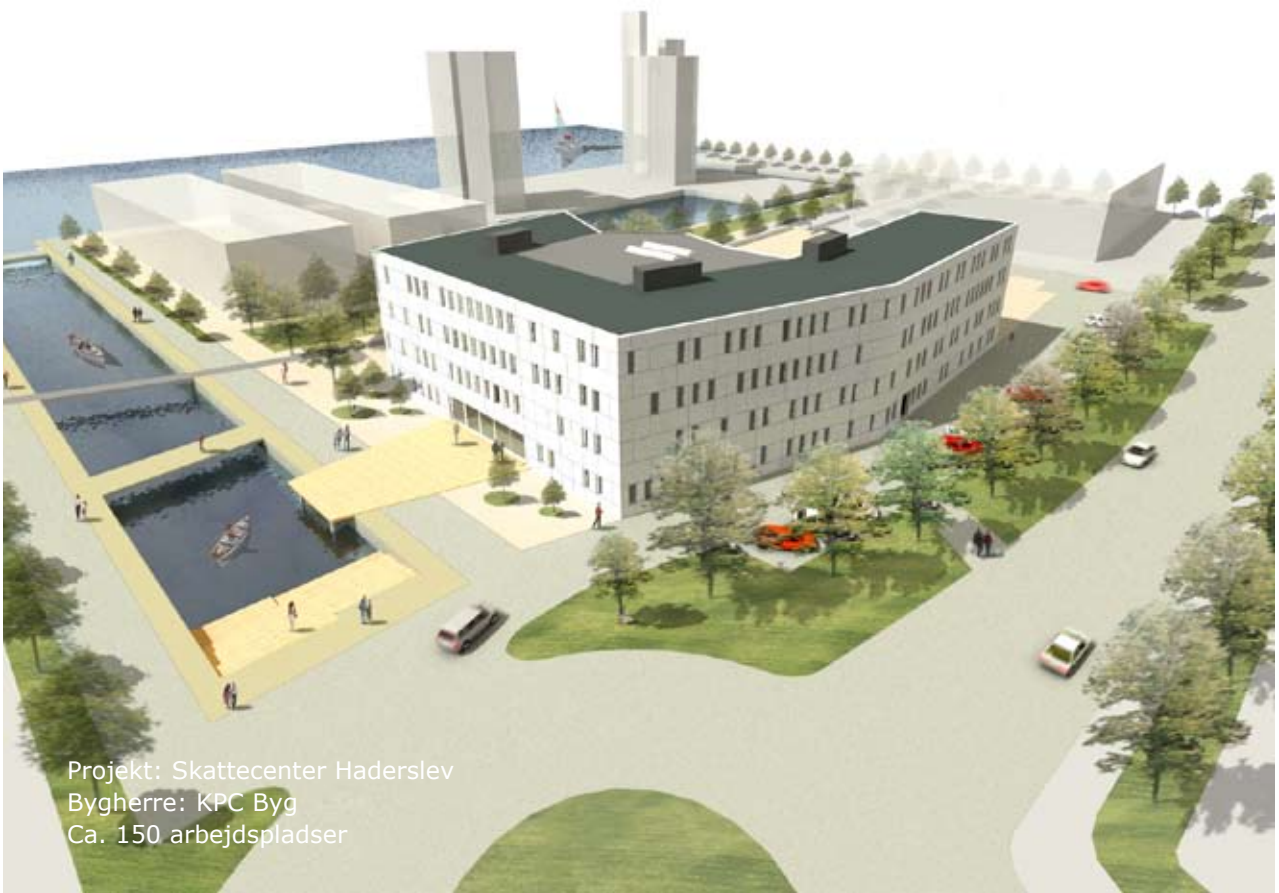
Projekt: Skattecenter Haderslev Bygherre: KPC Byg Ca. 150 arbejdspladser