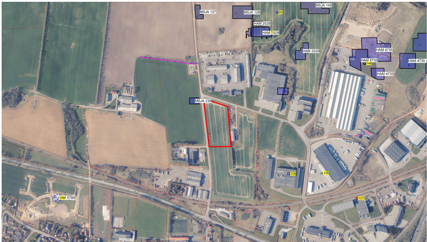
Kortbilag til 26/8062 vedr. batterianlæg på matr. 648 Hammelev Ejerlav, Hammelev (Haderslev Kommune).

De berørte områder er markeret med rød kontur. Ikke-fredede fortidsminder er markeret med numre på gul baggrund. Fredede fortidsminder er markeret med numre på rød baggrund. Arkæologiske undersøgelsesområder er markeret med blå skravering og journalnummer (HAM xxxx/MSJA xxx).