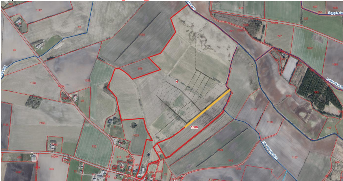
Figur 4: Kommende skelgrøft er vist med orange streg. Sort streg er eksisterende dræn. Blå streg er offentlige vandløb. Rød streg og tal viser matrikelgrænser og -numre. De relevante matrikler er vist med fed streg og tal.

Nye dræn føres til skelgrøften. Kravene til skelgrøftens skikkelse og område hvor der må nydrænes er angivet i vilkårene.