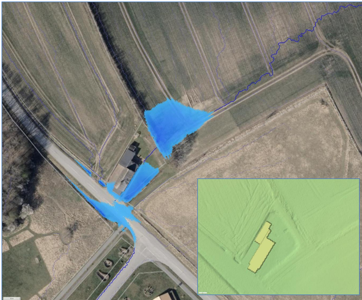
Figur 2 Overfladeafstrømning ved eksisterende forhold. Blå flade viser vandfyldte lavninger. Blå streg viser strømningsveje. Det indlejrede billede viser de eksisterende højdeforhold.

Fordi det alene vedrører vand, der løber på overfladen, anser Haderslev Kommune det ikke som nødvendigt at beskrive drænforholdene.