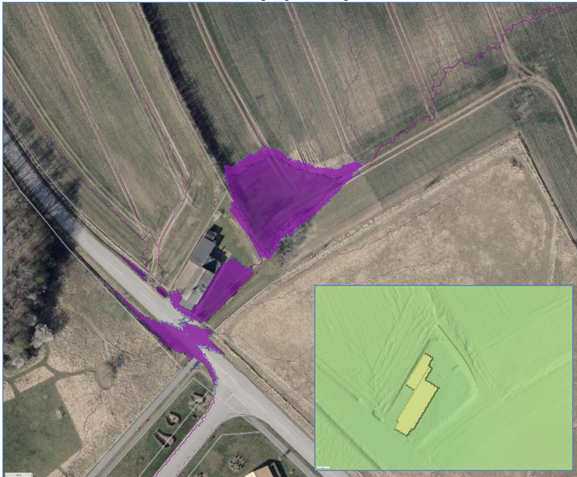
Figur 3 Overfladeafstrømning ved kommende forhold. Lilla flade viser vandfyldte lavninger. Lilla streg viser strømningsveje. Skraveret areal viser lavninger ved eksisterende forhold. Det indlejrede billede viser de eksisterende højdeforhold samt den modellerede ansøgte nye vold.

Haderslev Kommune har omsat skitsen fra ansøgningen til Scalgo