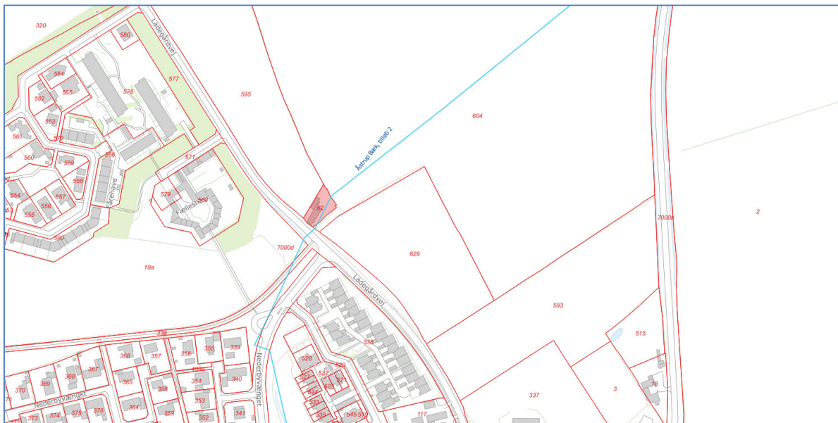
Figur 1: Den røde markering viser matr.nr 62. Rød streg viser matrikelskel. De blå linjer viser offentlige vandløb.

Haderslev Kommune tillader etablering af den ansøgte jordvold, med de givne vilkår, på din grund; matrikel 62 Åstrup Ejerlav, Åstrup